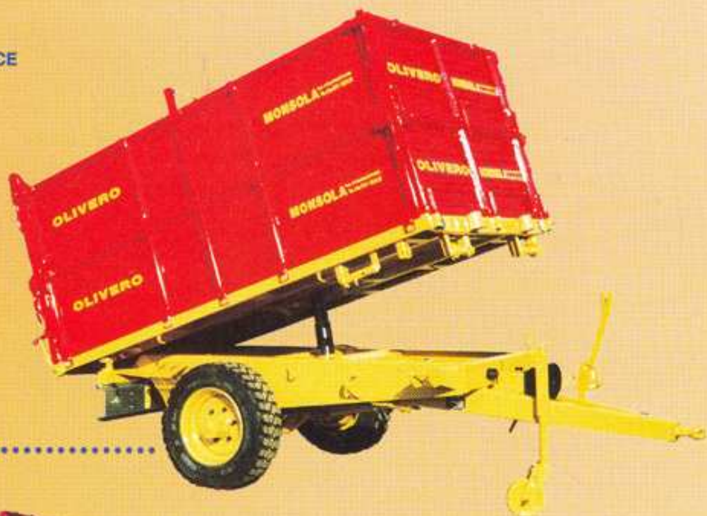
RIMORCHIO MONOASSE MOTTRICE