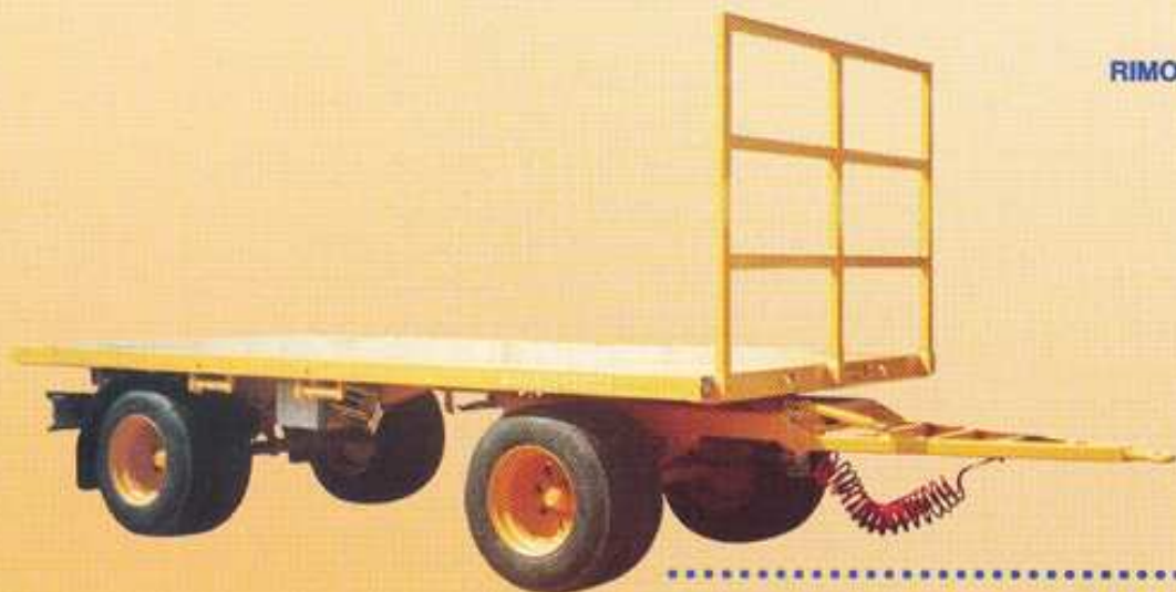
RIMORCHIO CON PIANALE FISSO a ruote gemellate