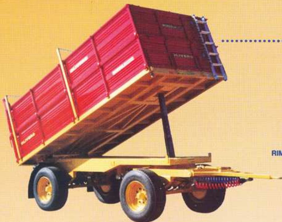
RIMORCHIO CON SPONDE SMONTABILI in ferro