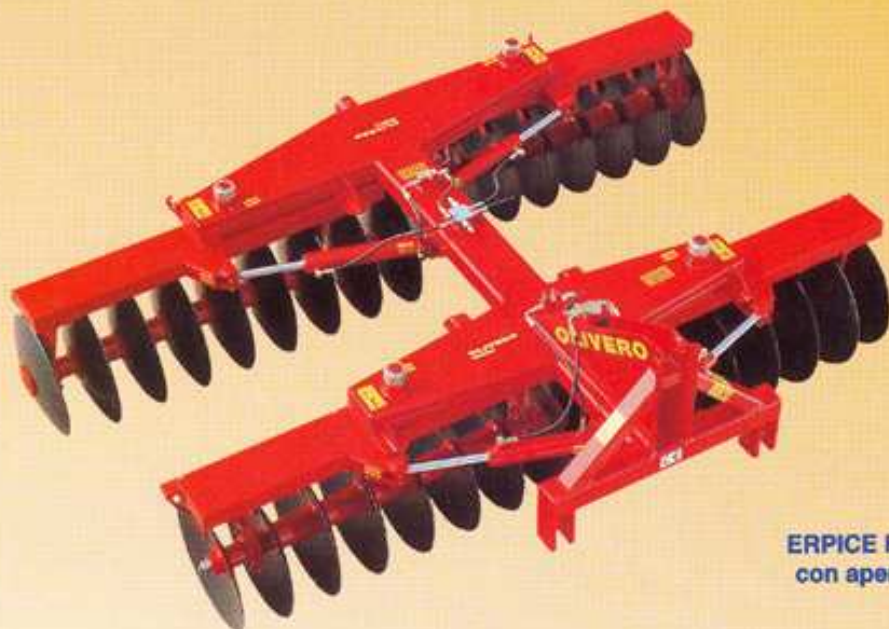
ERPICE FISSO A SOLLEVAMENTO con apertura e chiusura idraulica

* Tutti gli erpici sterzanti possono essere utilizzati fissi tramite l'impiego di due perni.