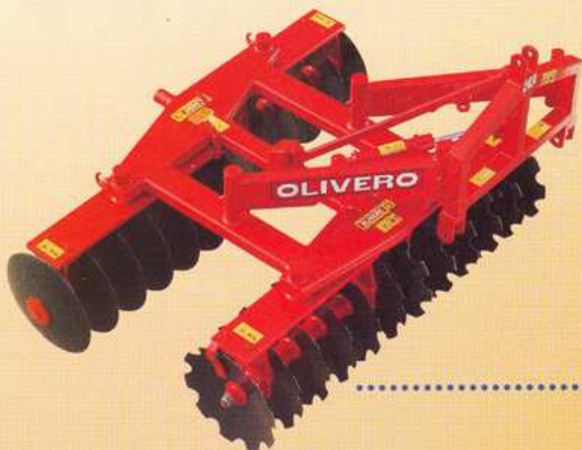
ERPICE FISSO A SOLLEVAMENTO con spostamento bilaterale idraulico