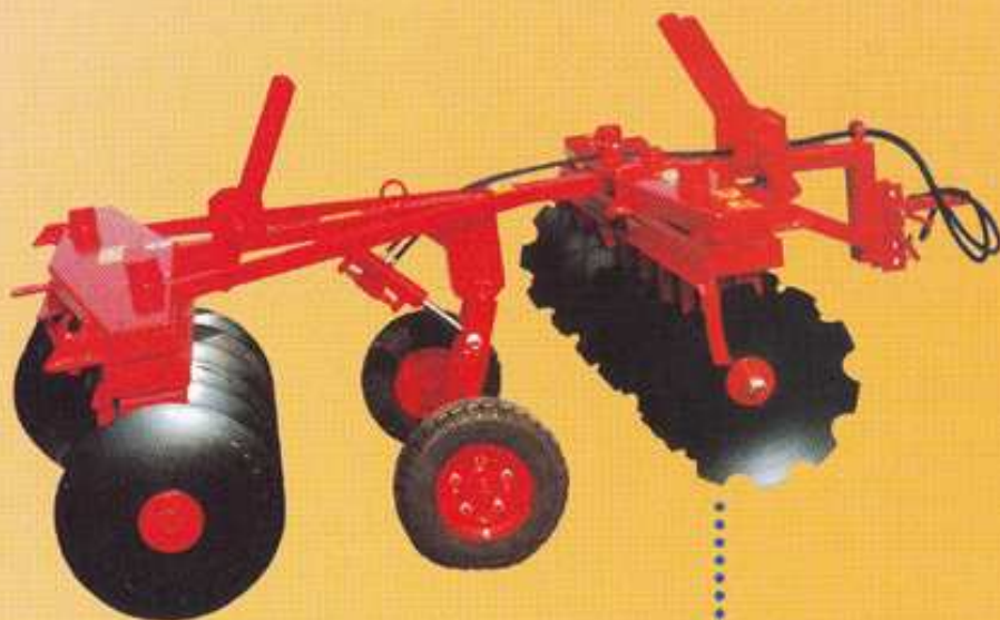
ERPICE STERZANTE A TRAINO con carrello idraulico per trasporto su strada

La regolazione degli elementi per il lavoro e la chiusura per il trasporto su strada viene fornita con sistema manuale o idraulico.